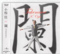
最終 (予定) オリジナルアルバム 関 ~ Takenawa ~ 3,000円 (税別) UICZ-4291 ユニバーサルミュージック